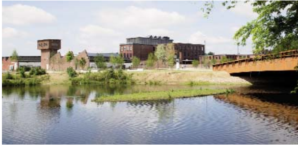
Blick auf die Spinnerei, die Brücke rechts im Bild verbindet sie mit der Weberei.